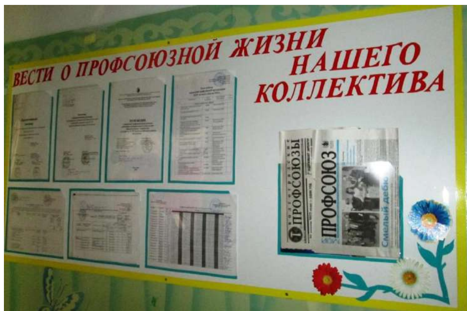
Рисунок 1. Информационный стенд

На стенде и на профсоюзной странице Первичной профсоюзной организации МОУ детский сад № 253 постоянно вывешивается и размещается необходимая профсоюзная информация (Рис. 1).